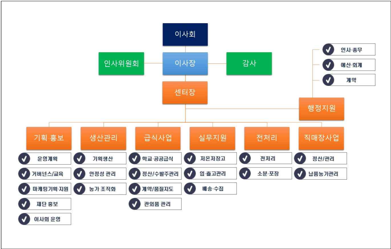
[별표2] 재단법인 춘천지역먹거리통합지원센터 정원표 (개정 2019.10.07.), (개정 2020.02.27.)