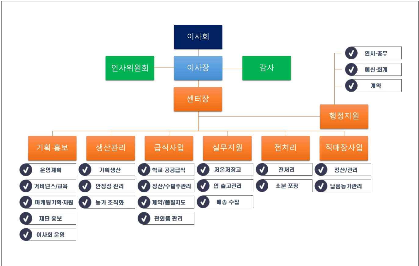
[별표2] 재단법인 춘천지역먹거리통합지원센터 정원표 (개정 2019.10.07.), (개정 2020.02.27.)